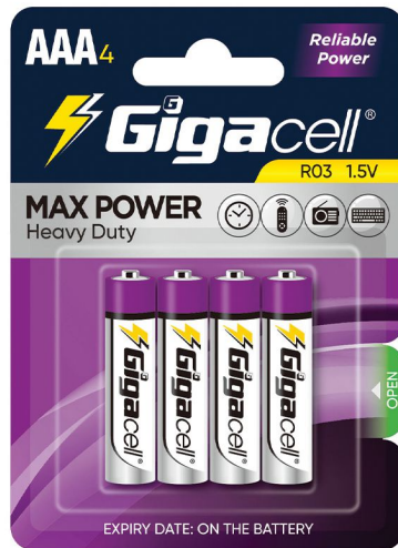
Max Power Heavy Duty