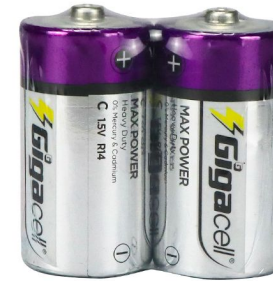
C-R14 -2pc Shrink