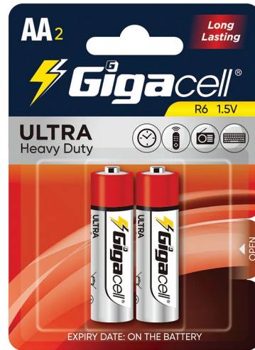
Ultra Heavy Duty